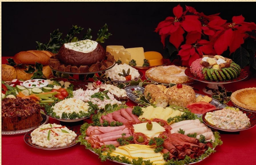
Стол № 2