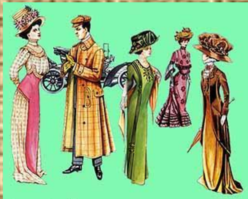
Дама и мужчина в дневном платье