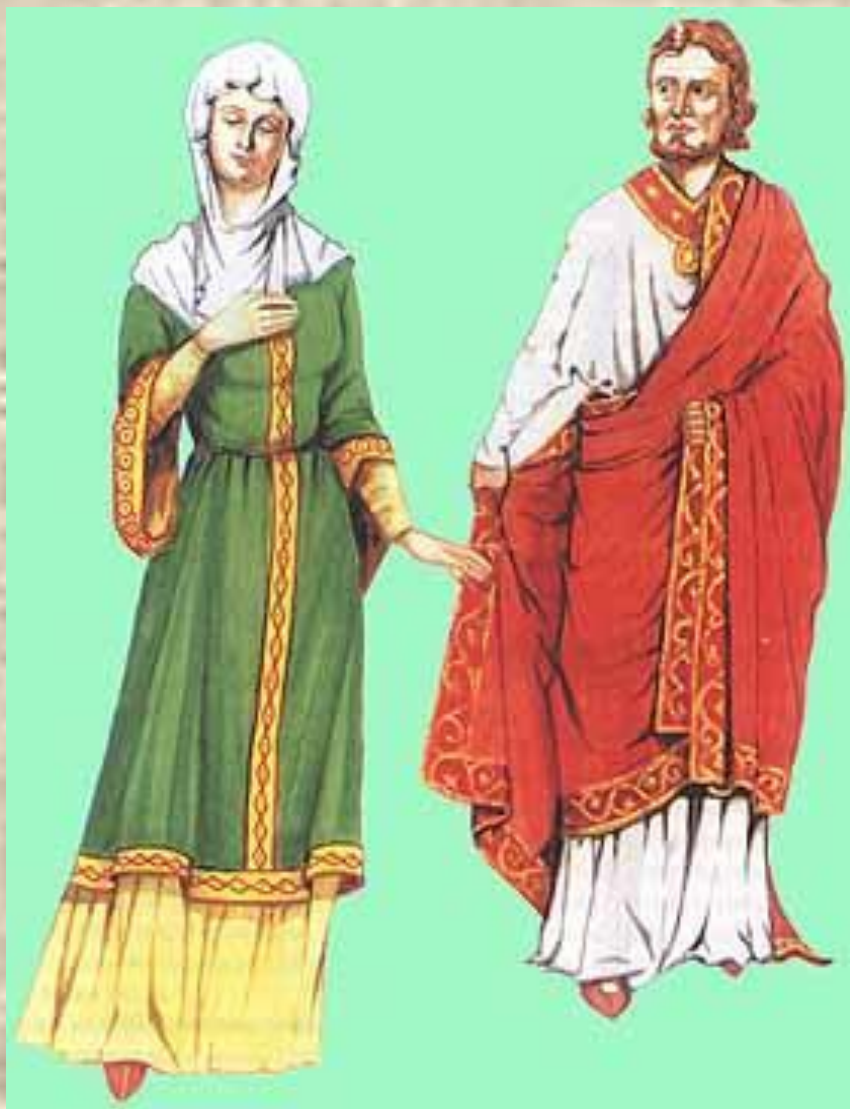
Мужчина и женщина из высшего сословия.