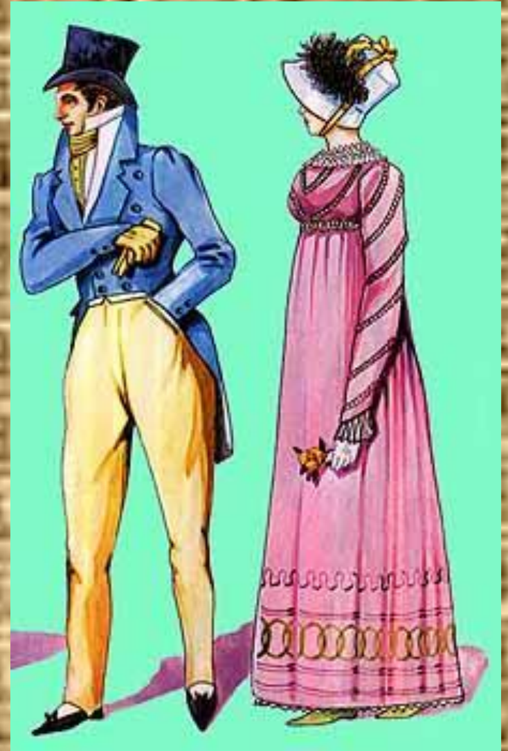
Дамы и кавалеры в выходных нарядах