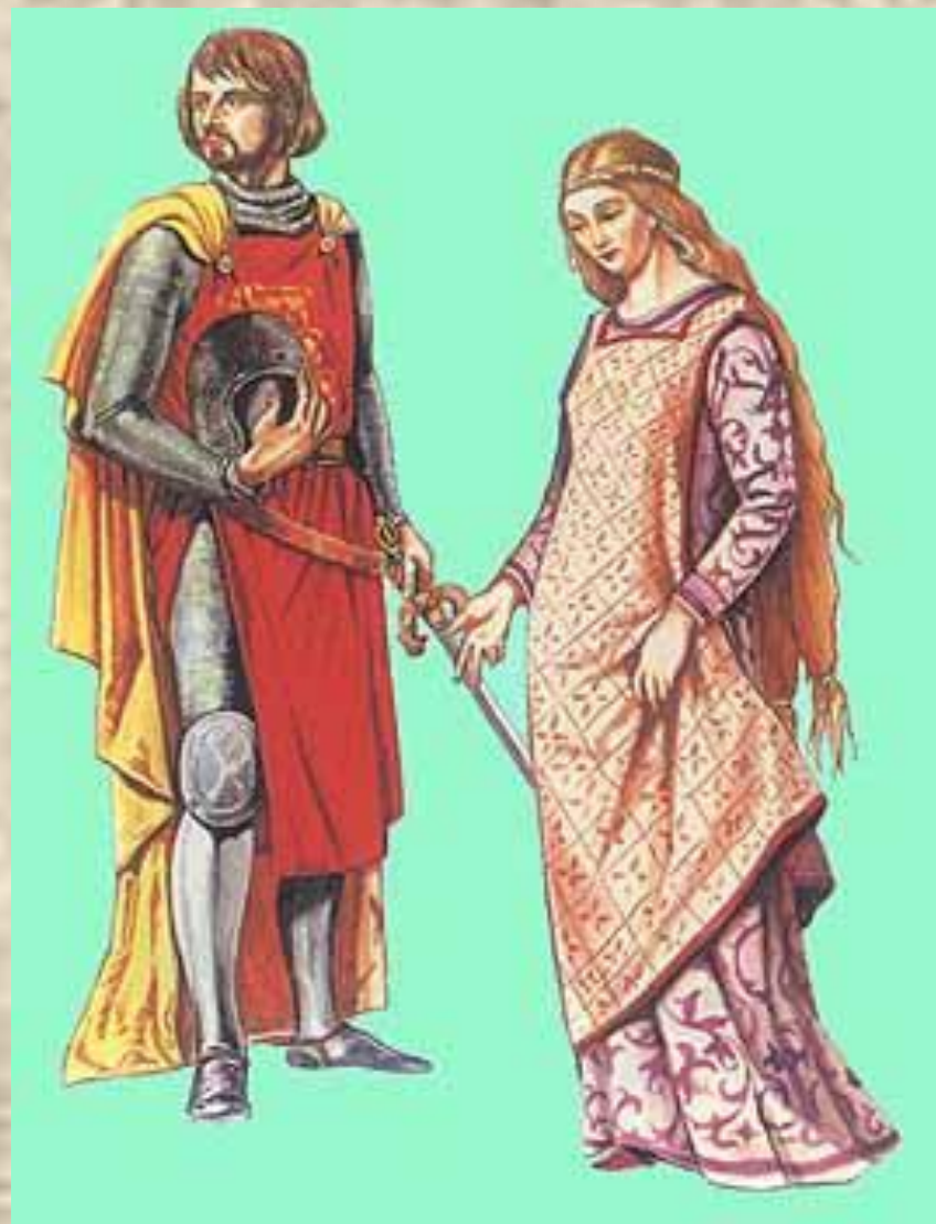
Рыцарь и дама.