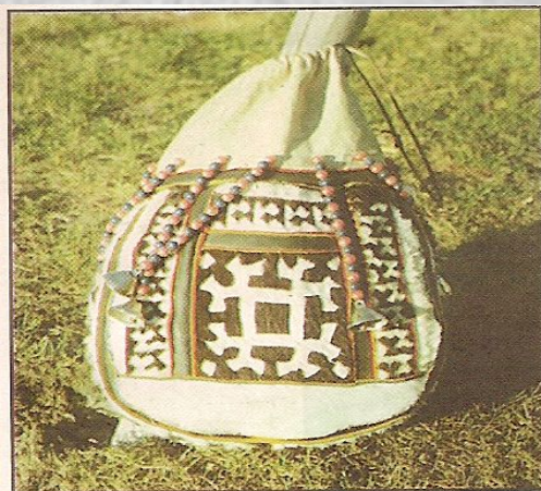
Сумочка для рукоделия. С. Казым (1990)