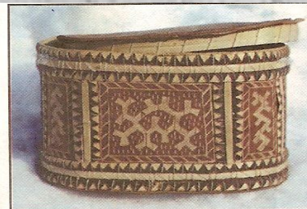
Коробочка из бересты. С. Казым (фото автора, 1990)