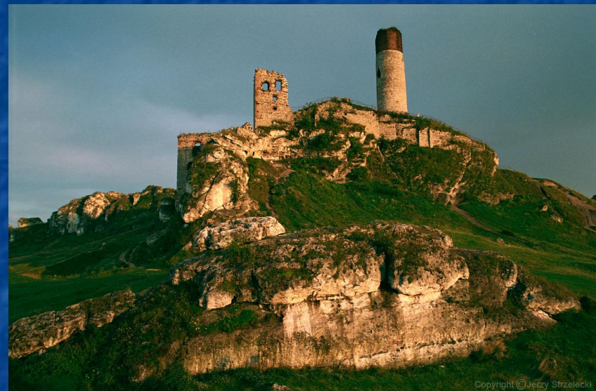
Крепость Ольштын. 15 век.