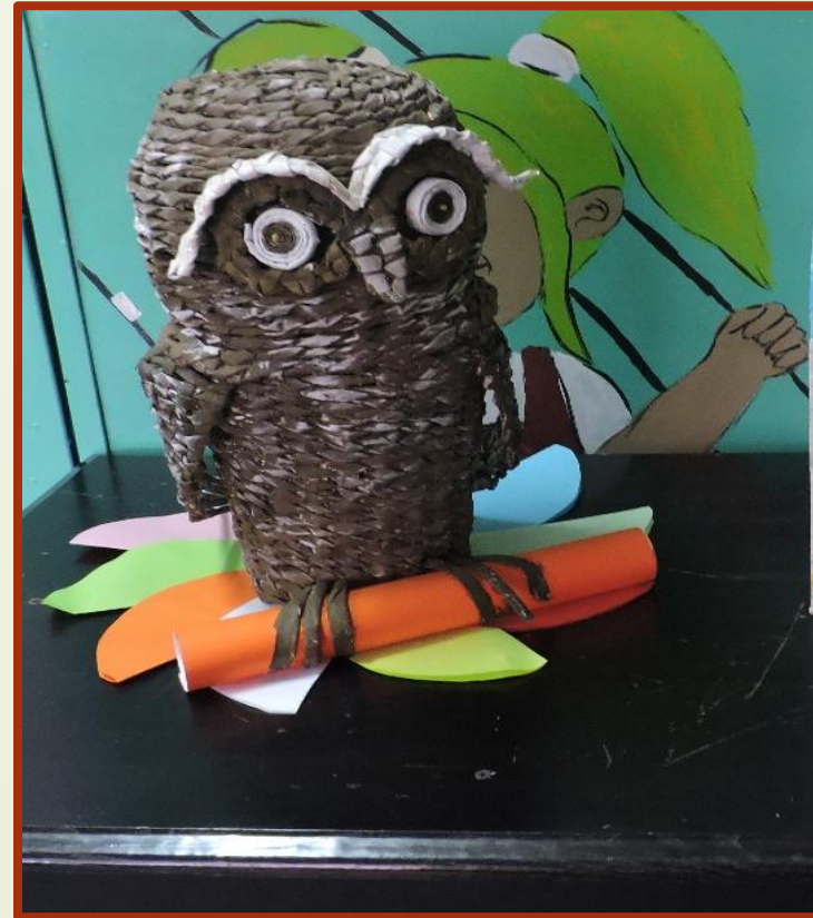
Сова из газетных трубочек