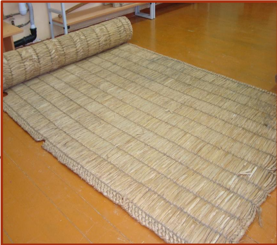
Циновка из рогоза