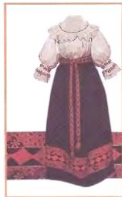
Русские народные свадебные костюмы