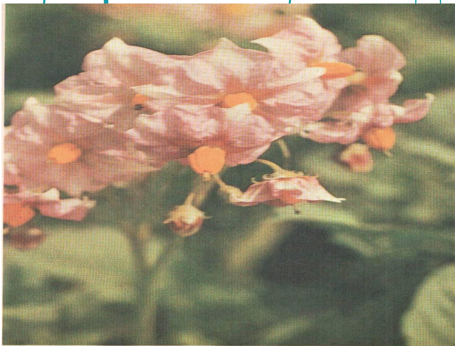
Соцветие картофеля (сорт Весна).