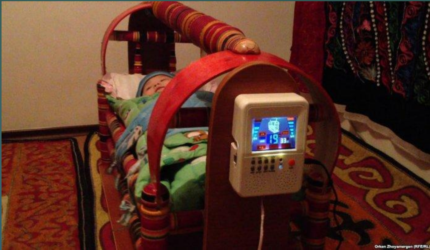
Orken Zhoyzmergen (RFE/RL)