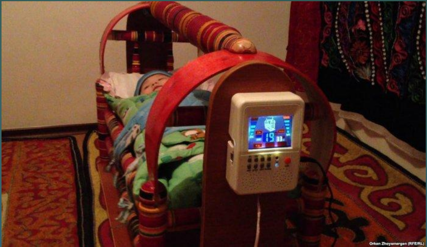
Orken Zhoyzmergen (RFE/RL)