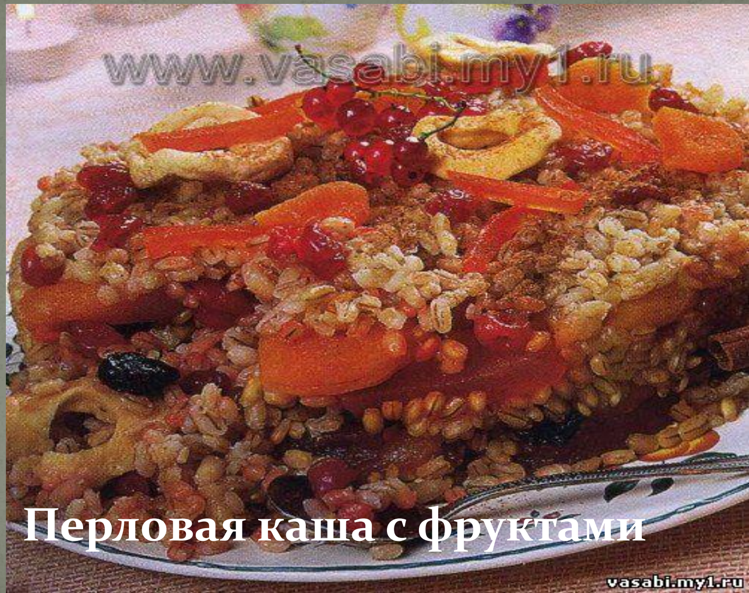
Перловая каша с фруктами