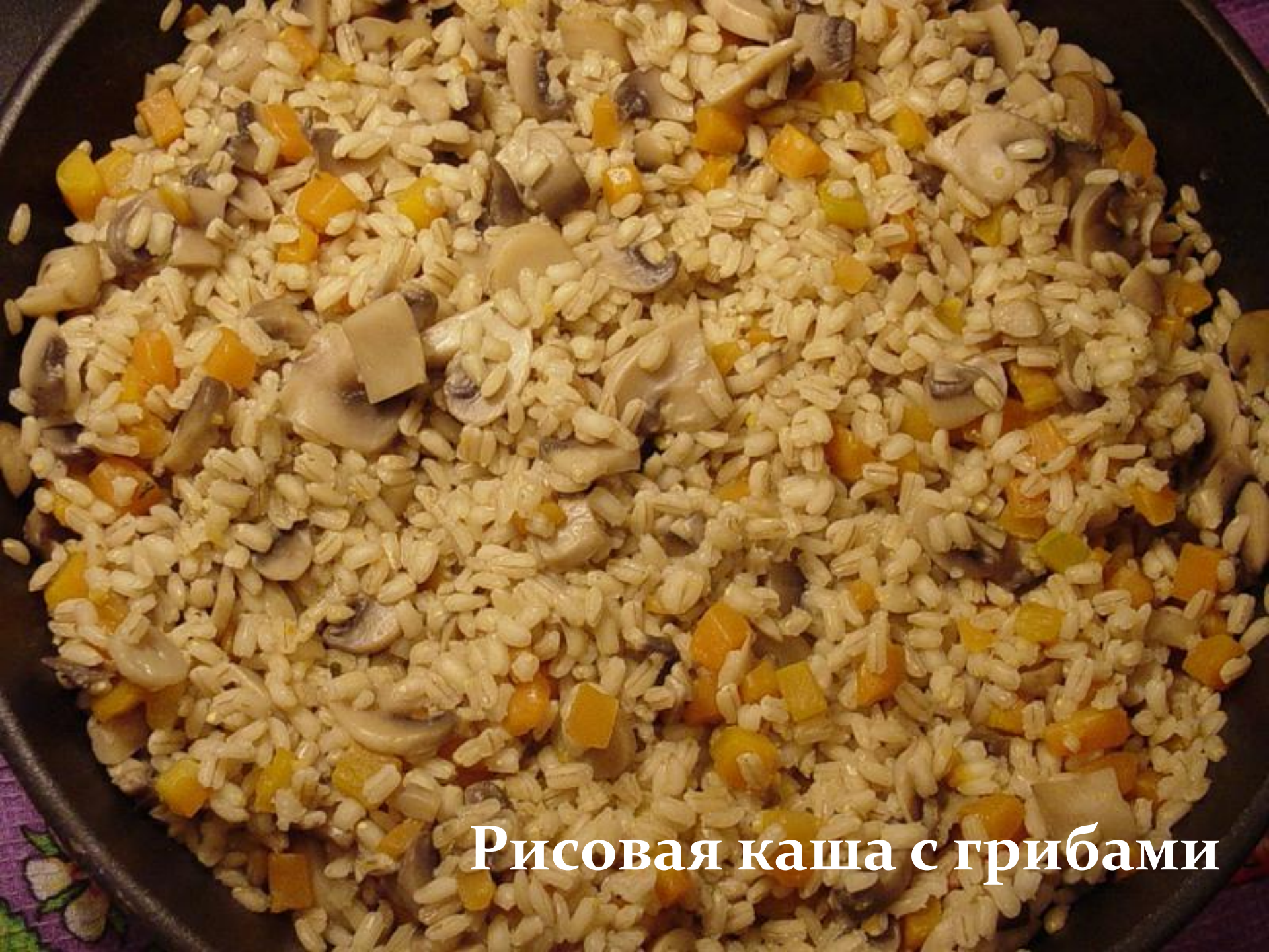
Рисовая каша с грибами