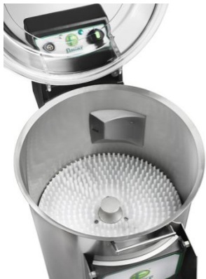
Машина для чистки мидий Fimar LCF/10M

Раковины открывают, вынимают из них мясо и еще раз промывают в кипяченой воде. Варено-мороженые мидии оттаивают на воздухе или в воде и промывают.