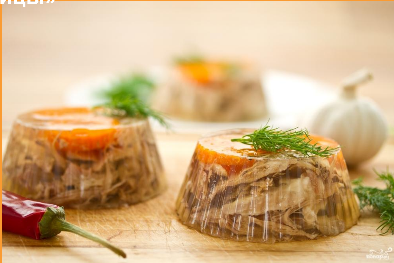
Фото холодной закуски: «Заливное из курицы»