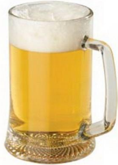
Пиво светлое 0,5 Л.