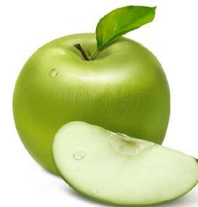
Яблоки 800 ГР.