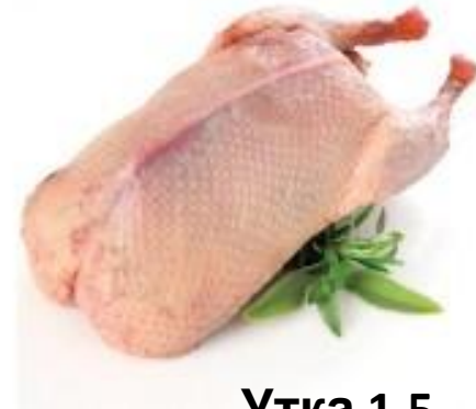
Утка 1,5 КГ.