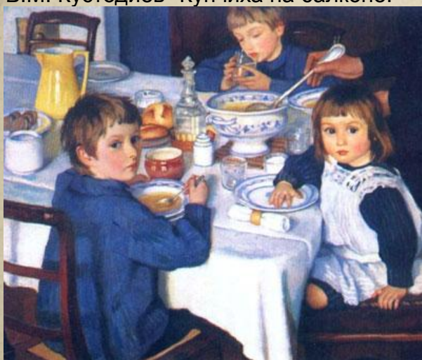
З.Серебрякова "За обедом."