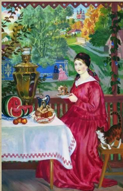
Б.М. Кустодиев "Купчиха на балконе."