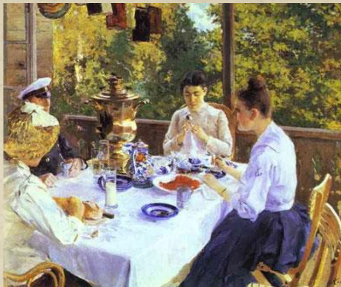
К.Коровин "За чаем."