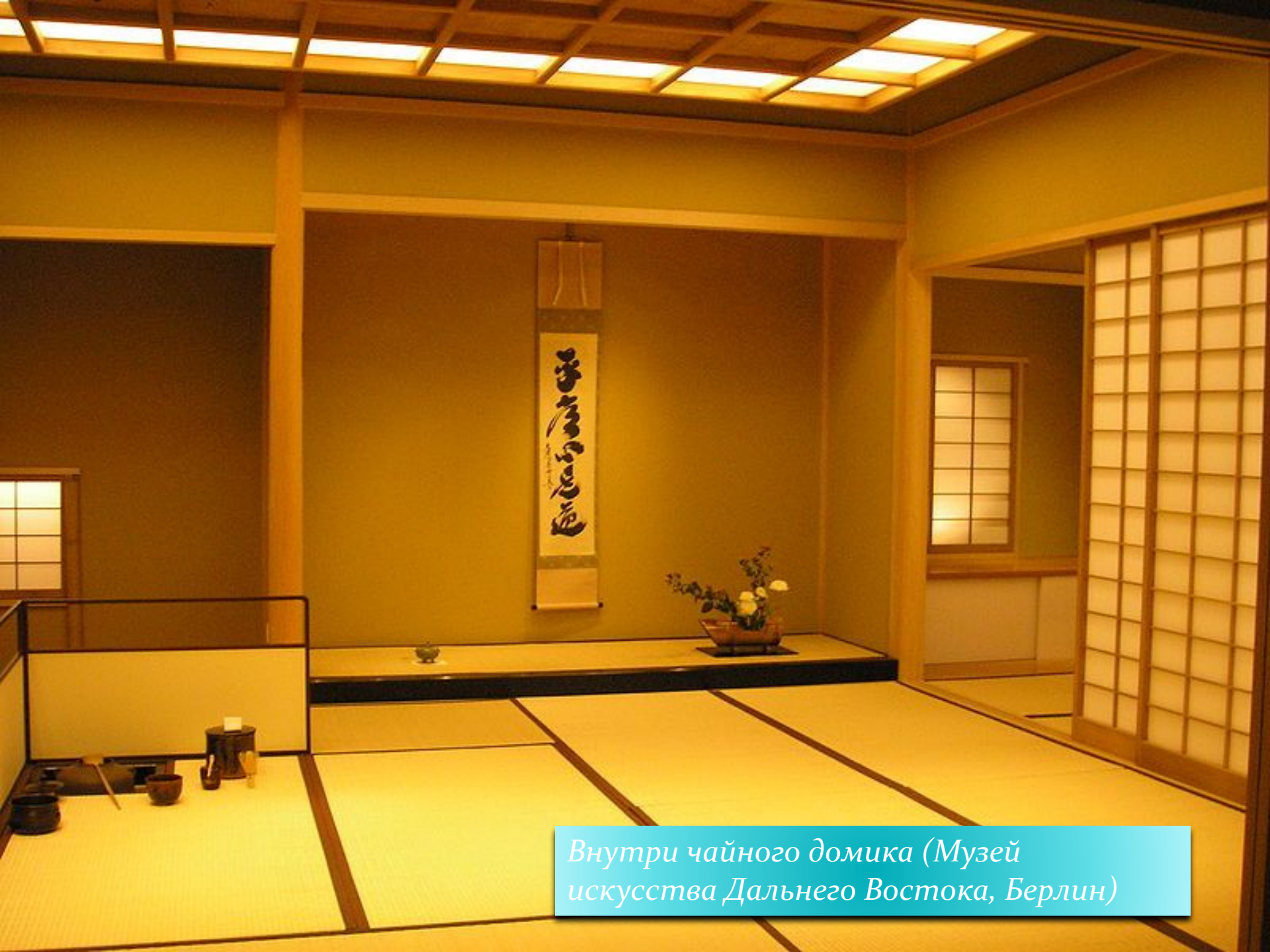
Внутри чайного домика (Музей искусства Дальнего Востока, Берлин)