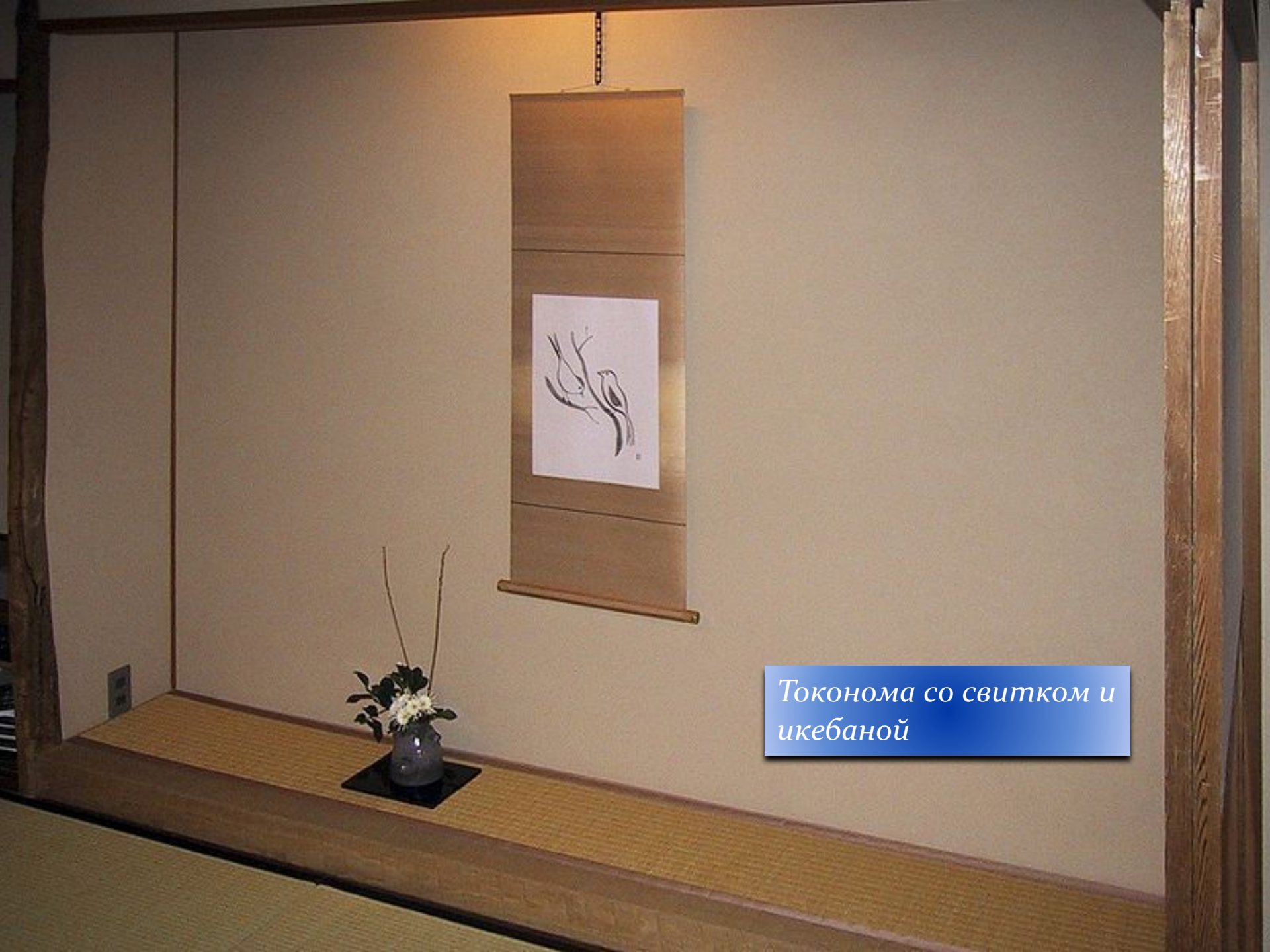
Токонома со свитком и икебаной