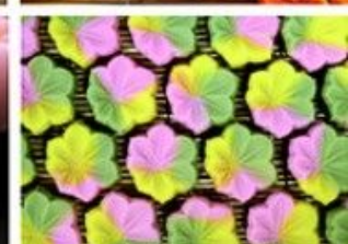
Вагаси - традиционные японские сладости