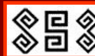
память о прошлом