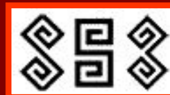
память о прошлом