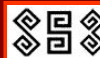
память о прошлом