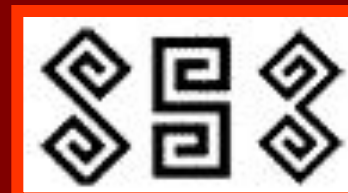
память о прошлом