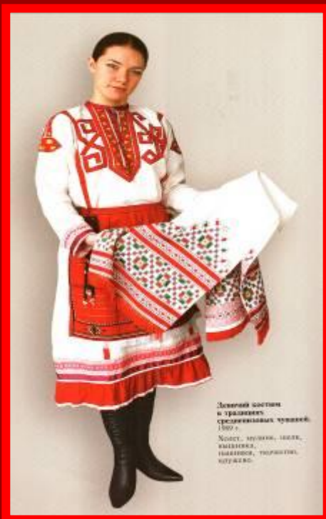
Детский костюм и традиция средневековой чувшии. 1900 г. Носы, мушкет, шёлк, краски, вышивка, орнамент, культура.