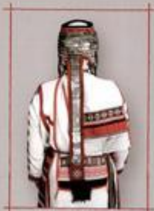
Қазақ халқының дәстүрлі киімі. Дөппе. 14-16 жасына арналған.