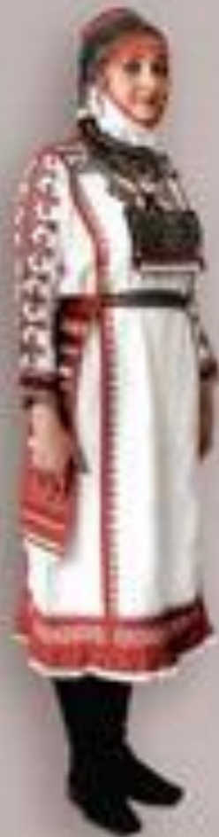
Қазақ халқының дәстүрлі киімі. Дөппе. 14-16 жасына арналған.