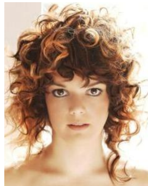
Не фиксированная форма