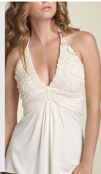
Глубокий вырез, топы на бретельках