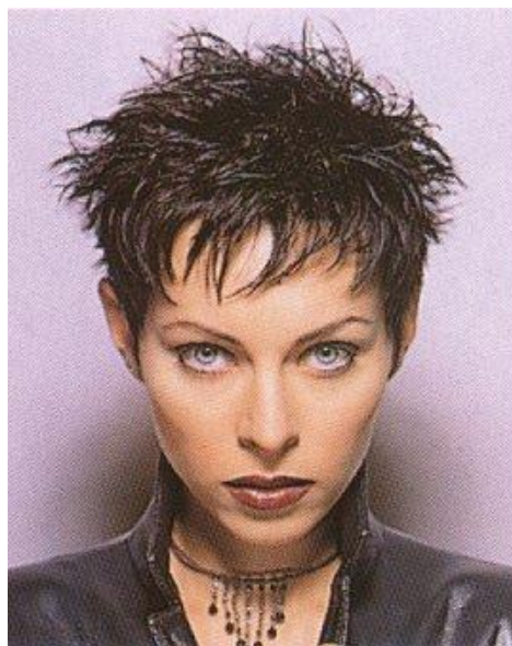
Большое количество лака