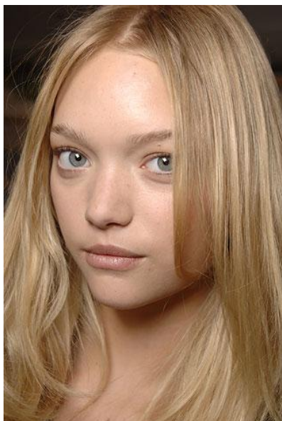
Длинные, распущенные волосы