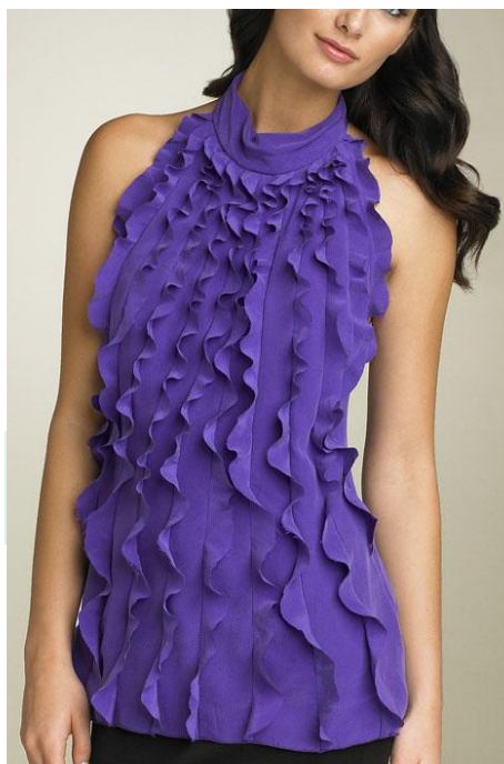
Яркие цвета, рюши