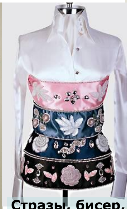
Стразы, бисер, яркий декор