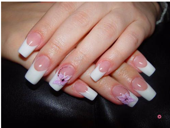
Маникюр со стразами и рисунком