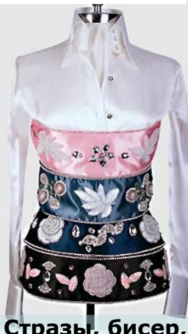
Стразы, бисер, яркий декор