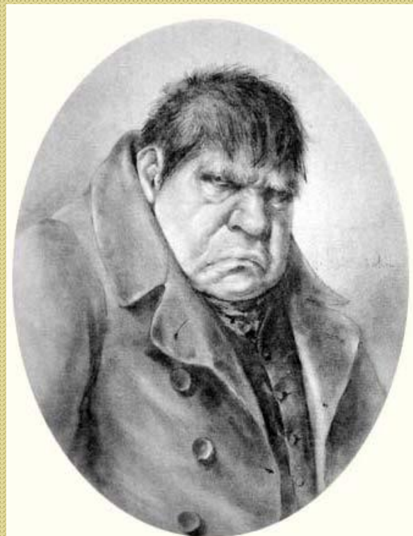
Михайло Семёнович Собакевич