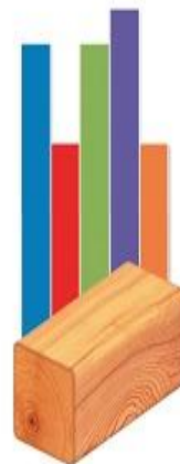
Брус естественной влажности с утеплителем