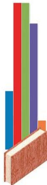
Каркасные дома (SIP-панель)