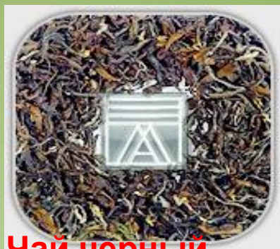
Чай черный листовой .