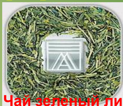
Чай зеленый листовой