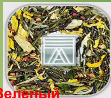
Зеленый ароматизированный листовой чай.