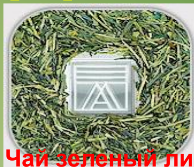
Чай зеленый листовой