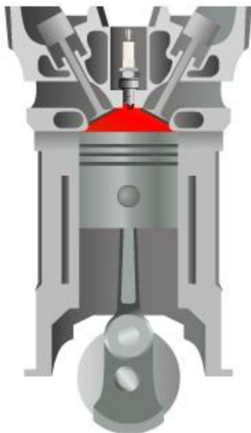
III такт рабочий ход