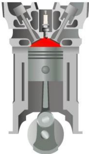
II такт сжатие