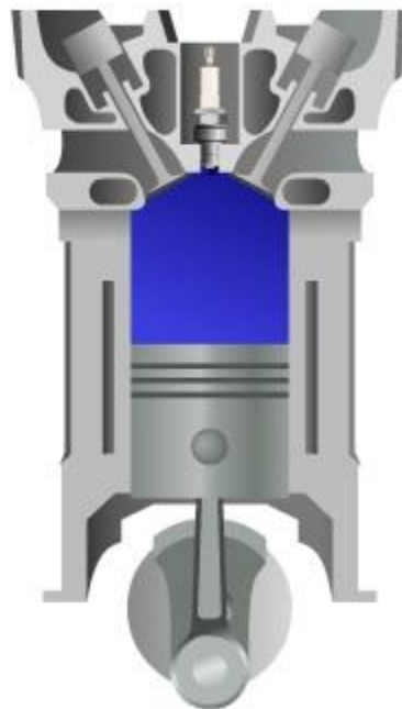
III такт рабочий ход