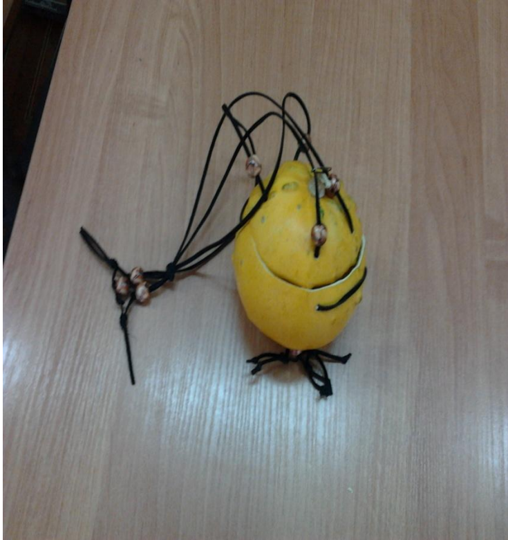
БИОСУМКА СЕМЬИ ЧУПИНЫХ