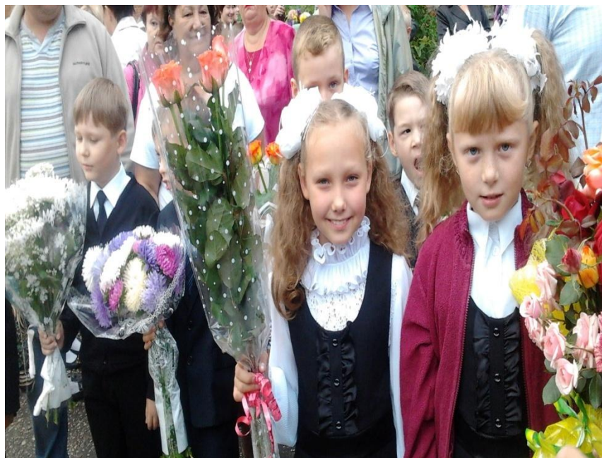
ДЕТИ И РОДИТЕЛИ