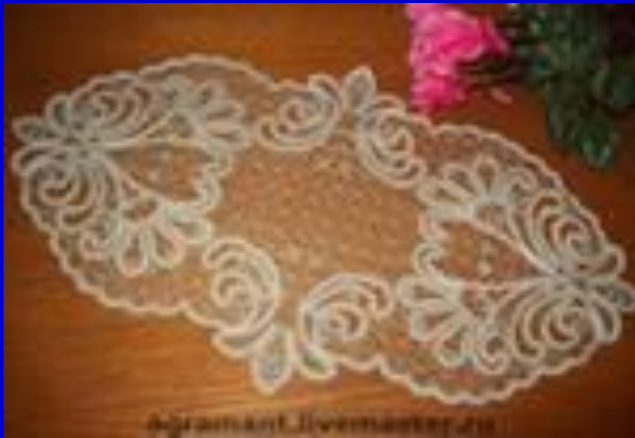
Agramant, Iivemaster, 20