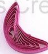
изогнутый полукруг (месяц, полумесяц)