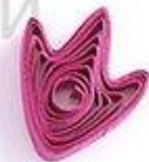
утиная лапка (птичья лапка)