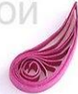
изогнутая капля (крыло, лепесток)