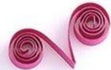
завиток в форме V