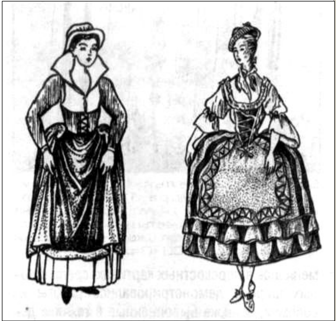
Городской костюм (Германия, XVI в.)