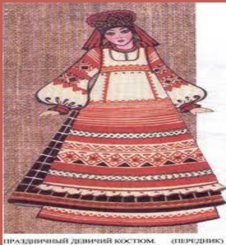
ПРАЗДНИЧНЫЙ ДЕВИЧИЙ КОСТЮМ. (ПЕРЕДНИК)