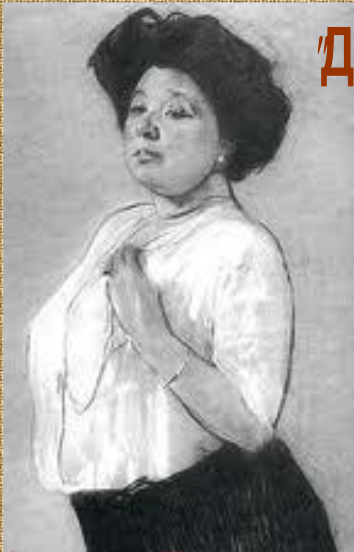
Надежда Петровна Ламанова (1861- 1941г.г)

“Для чего создается костюм для кого, из чего”