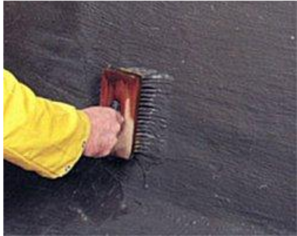
Обмазувальна гідроізоляція на мінеральній основі