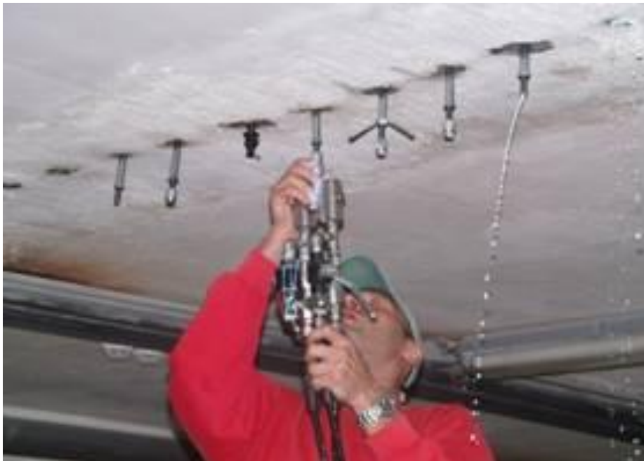
Ін'єктування тріщин та активних протікань