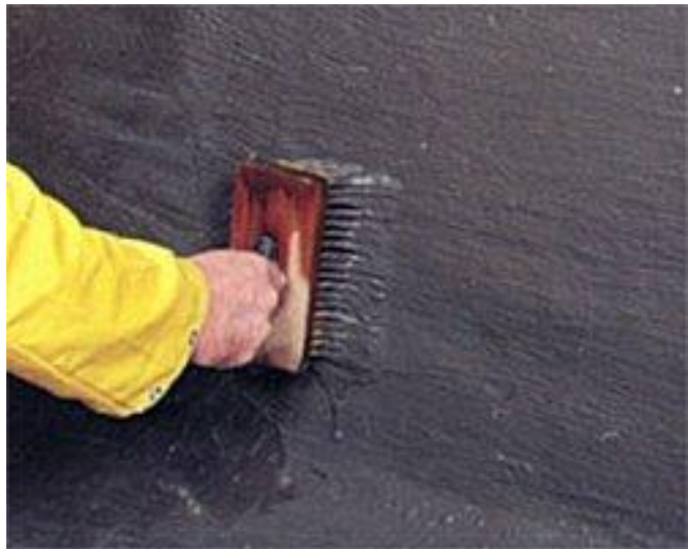
Обмазувальна гідроізоляція на мінеральній основі