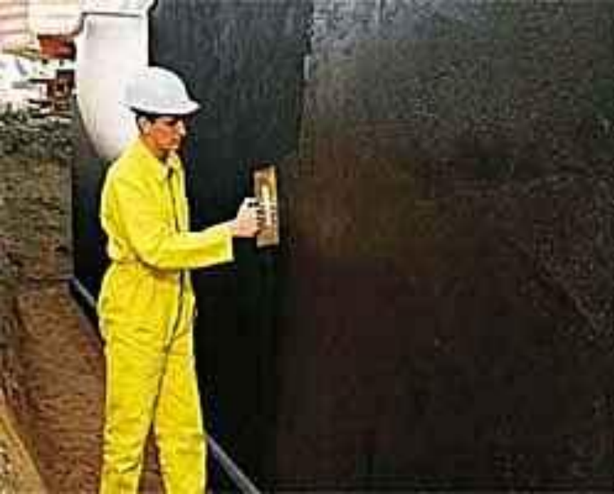
Обмазувальна гідроізоляція на бітумній основі