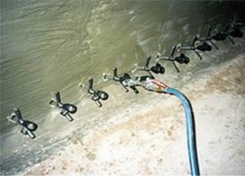
Відсічна горизонтальна гідроізоляція