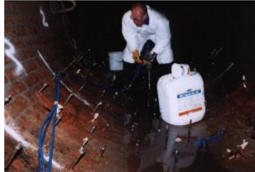
Загороджувальна ін'єкційна гідроізоляція