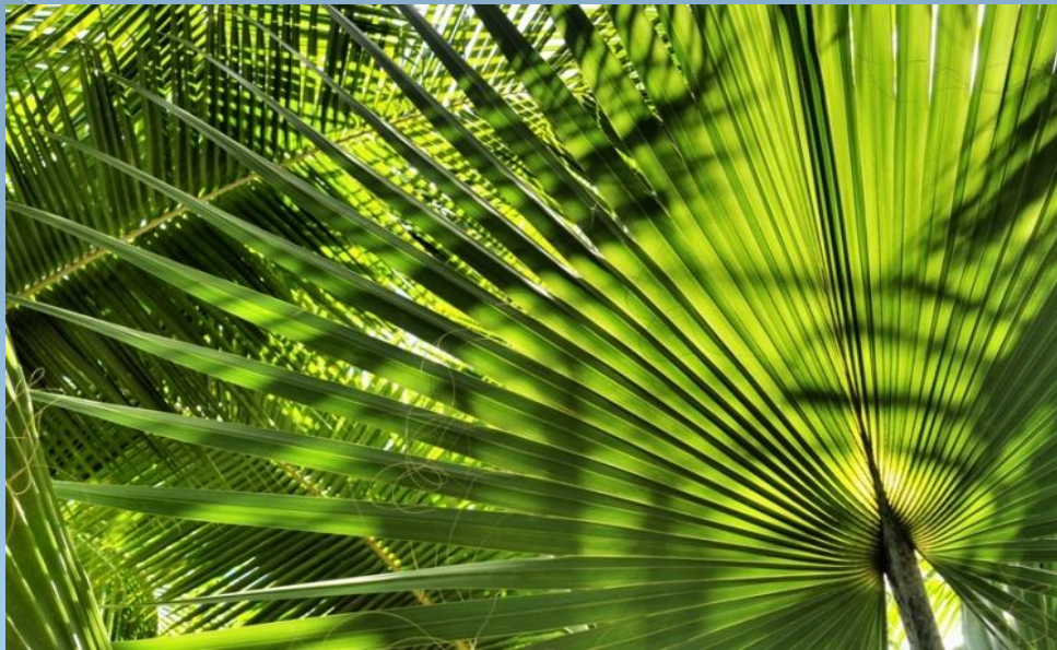
Лист южнокитайской ливистонии

Свободнонесущей конструкции защитного навеса при въезде в один из самых длинных и глубоких современных тоннелей — тоннель под Монбланом