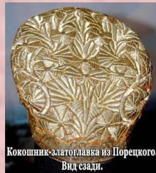
Кокошник-златоглавка из Порецкого. Вид сзади.

Кокошник не просто украшал головы, а был женским оберегом.