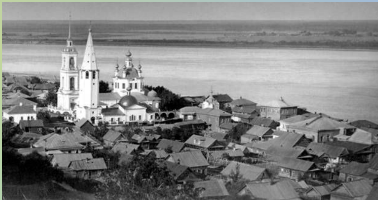
Село Катунки. 1905 год.

В России строчевая вышивка как промысел возникла в большом приволжском торгово-промышленном селе Катунки, находящимся в северо-западной части Нижегородской губернии (ныне Чкаловский район Нижегородской области). Село Катунки долгое время было одним из центров кружевного производства.