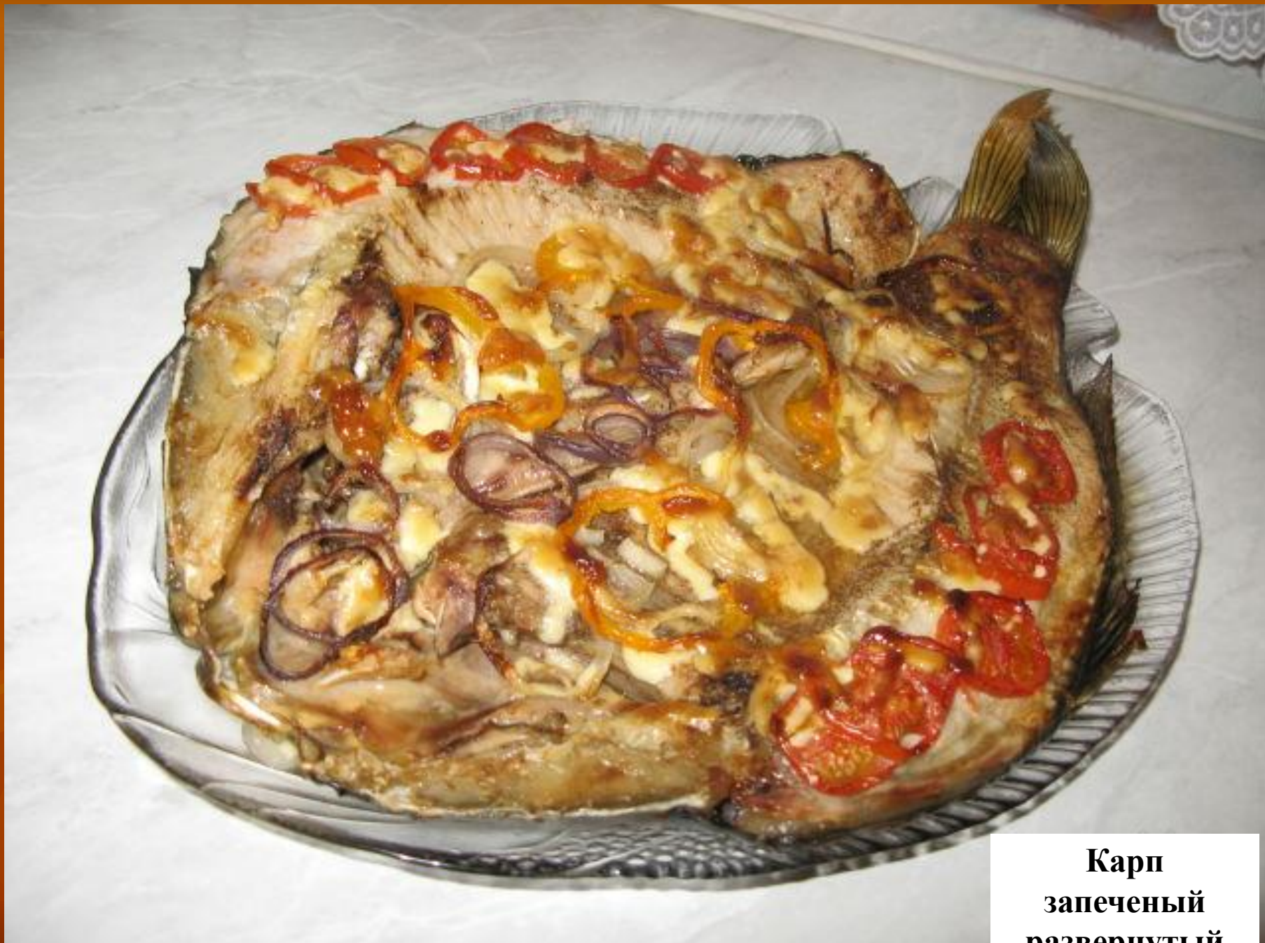
Карп запеченый развернутый