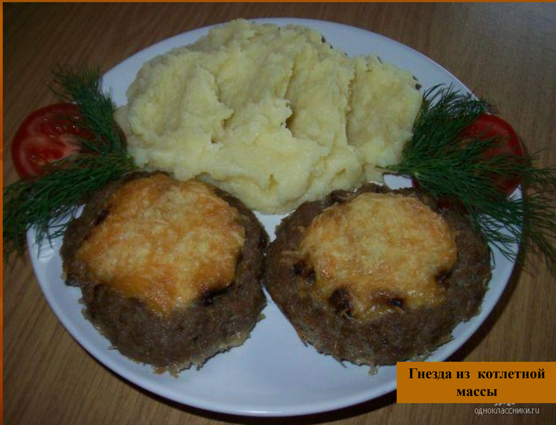
Гнезда из котлетной массы