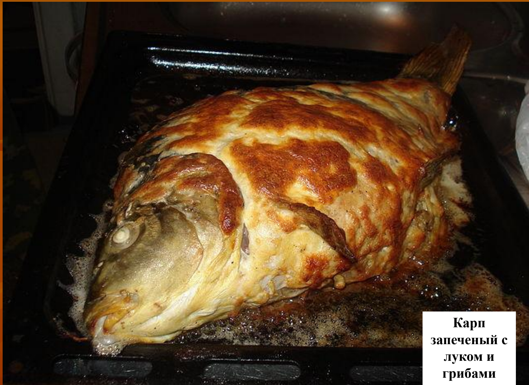
Карп запеченый с луком и грибами