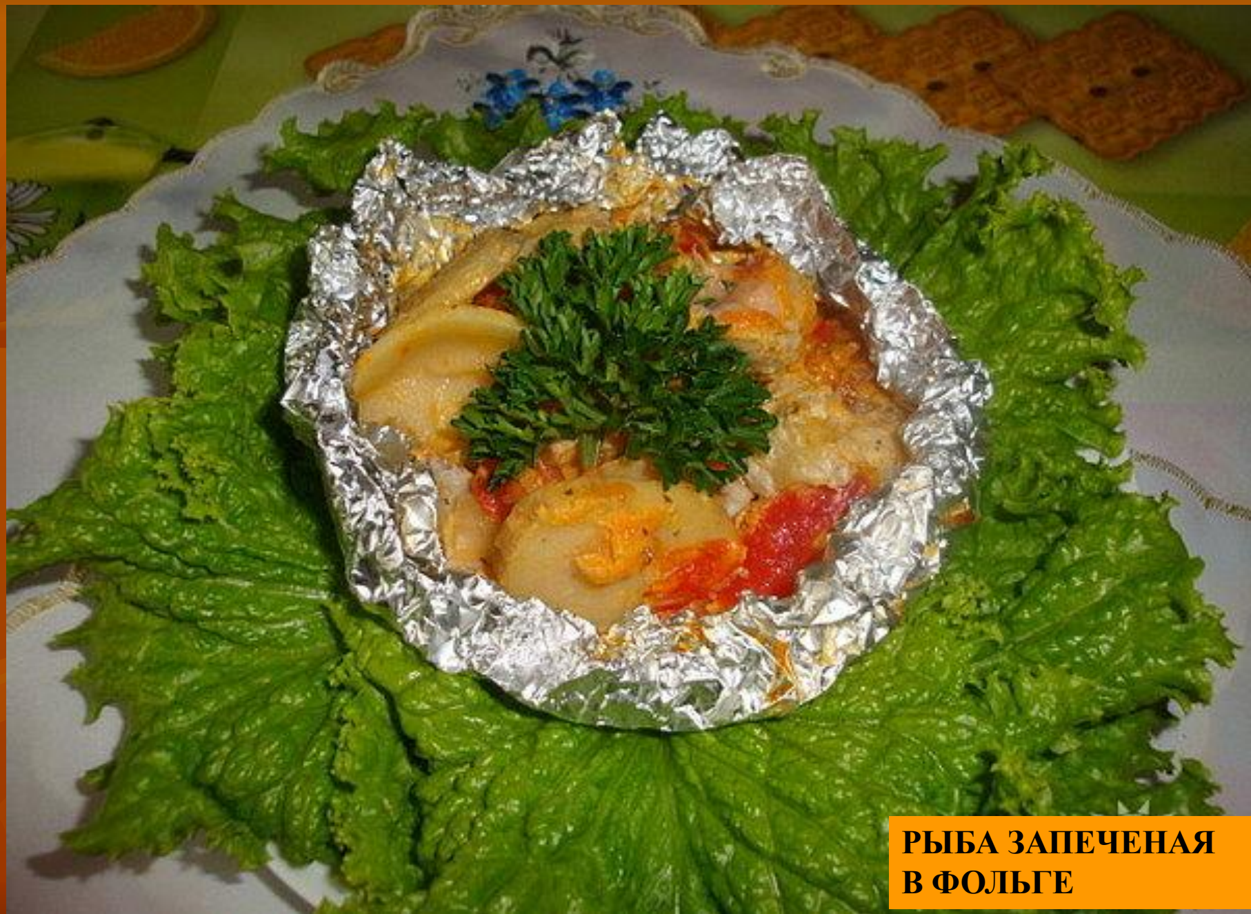
РЫБА ЗАПЕЧЕНАЯ В ФОЛЬГЕ