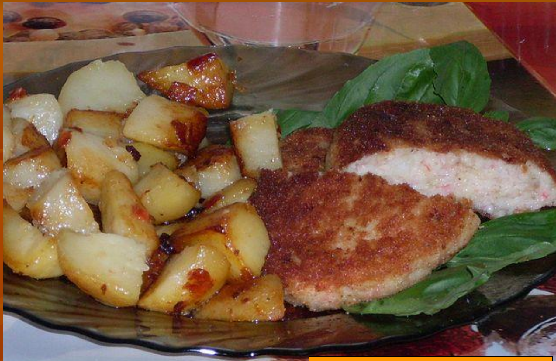
КОТЛЕТЫ ИЗ РЫБЫ