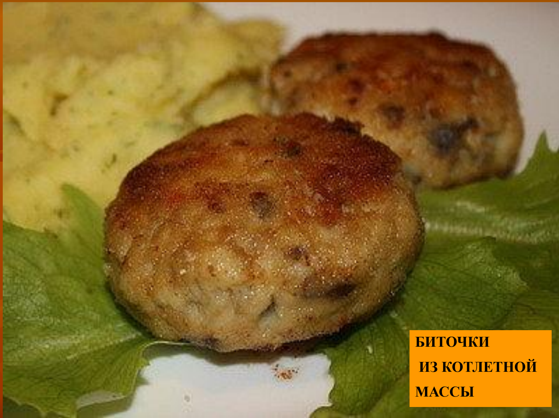
БИТОЧКИ ИЗ КОТЛЕТНОЙ МАССЫ