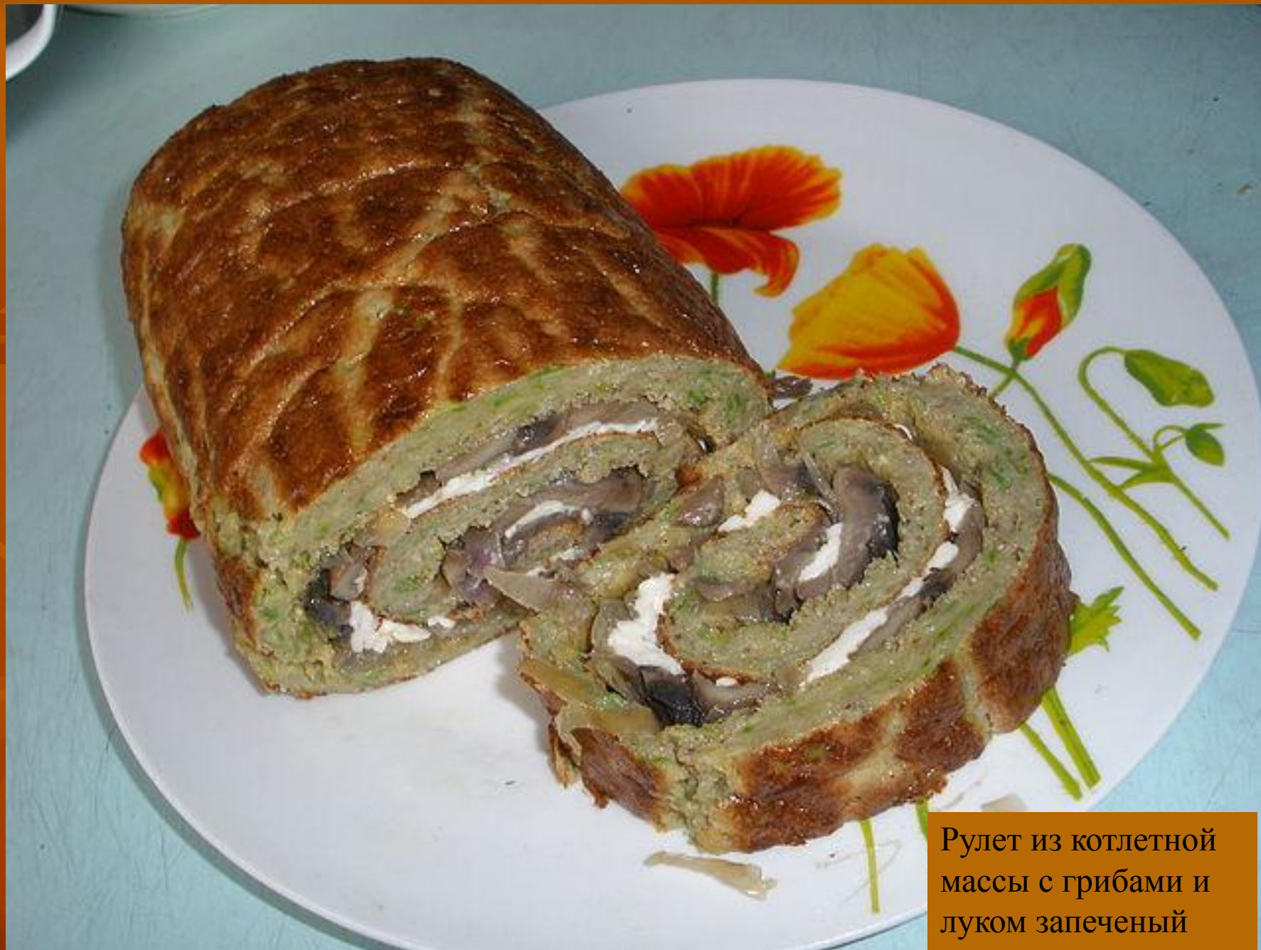
Руллет из котлетной массы с грибами и луком запеченый