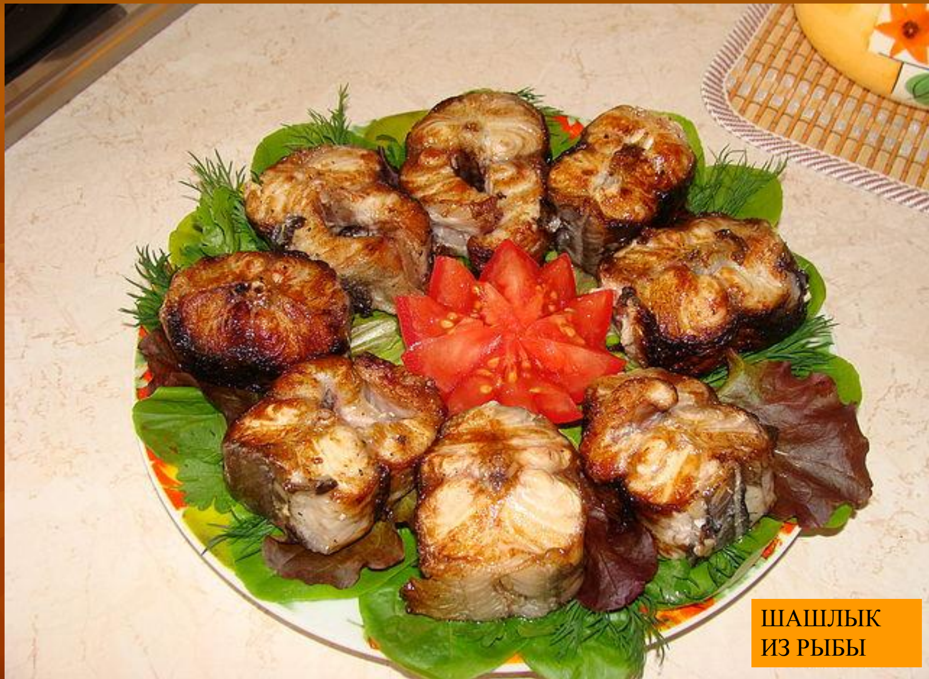
ШАШЛЫК ИЗ РЫБЫ