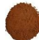
Raw Cacao Powder