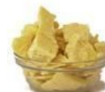
Raw Cacao Butter