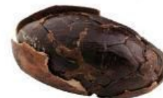
Raw Cacao Bean (peeled)