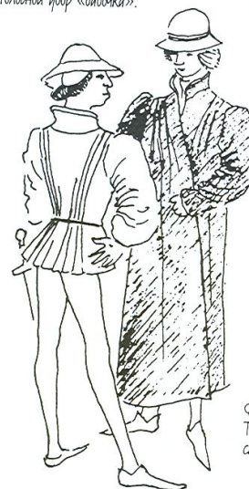
Фламандская мода, 1460 г. Тунники с закрепленными складками.