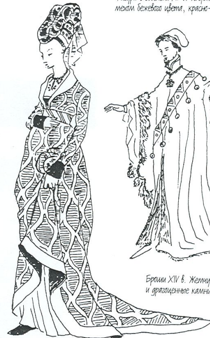
Фигура с gobелена XV в. Толстая мантия, набитая мехом бежевого цвета, красно-зеленая перьями.