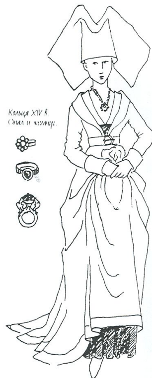
Конец XIV в. Омел и жемчуг.