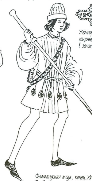
Фламандская мода, конец XV в. Толстая тунника, красно-розовая шпальта и штаны-шурки.