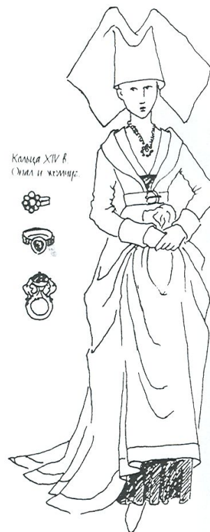
Конец XIV в. Омел и жемчуг.