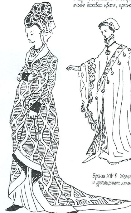
Фигура с gobelena XV в. Толстая мантия, набитая мехом бежевого цвета, красно-зеленая перьями.