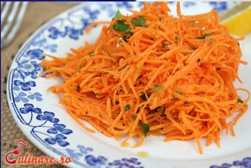
Морковь по- французски