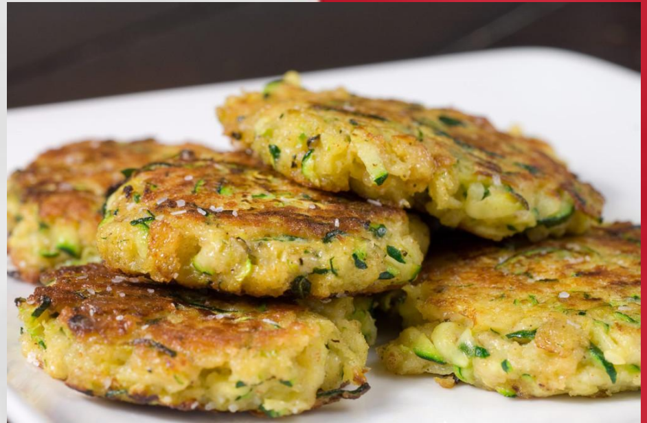
Оладьи из кабачков цуккини с цветами