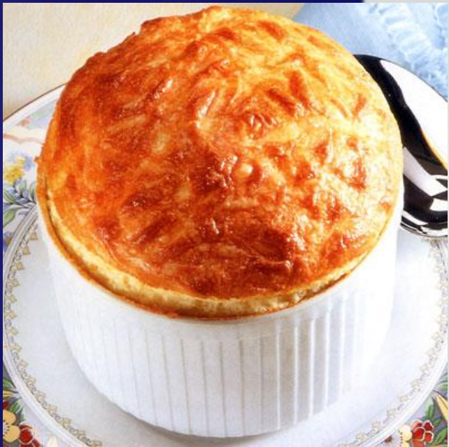
Суфле с сыром