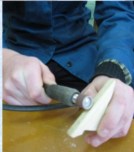
Правка и шлифовка поверхности деталей