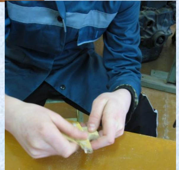
Окончательная зачистка деталей изделия