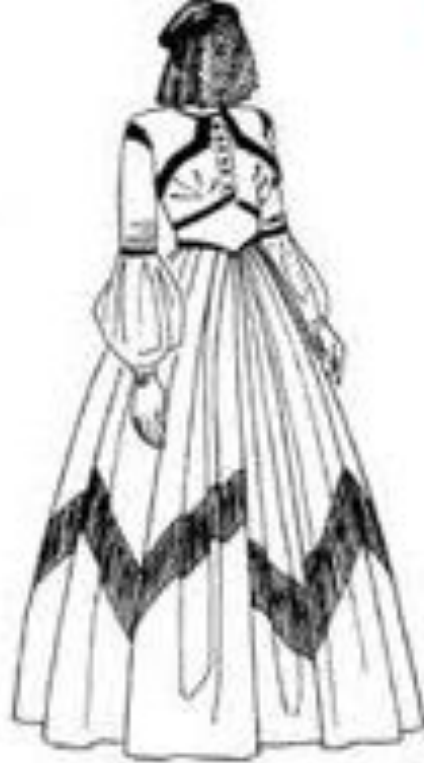
Рис. 9. Одежда стиля романтизм