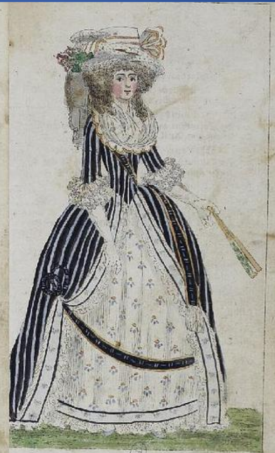
Parisienne en grande parure. Sept. 1788