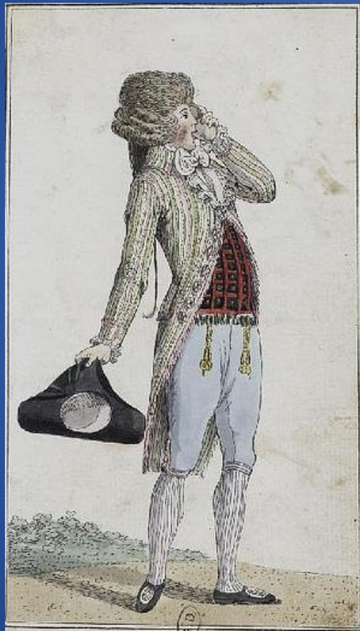
Élegant de Paris