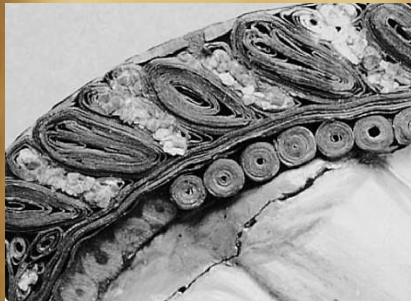
Рамка более крупным планом