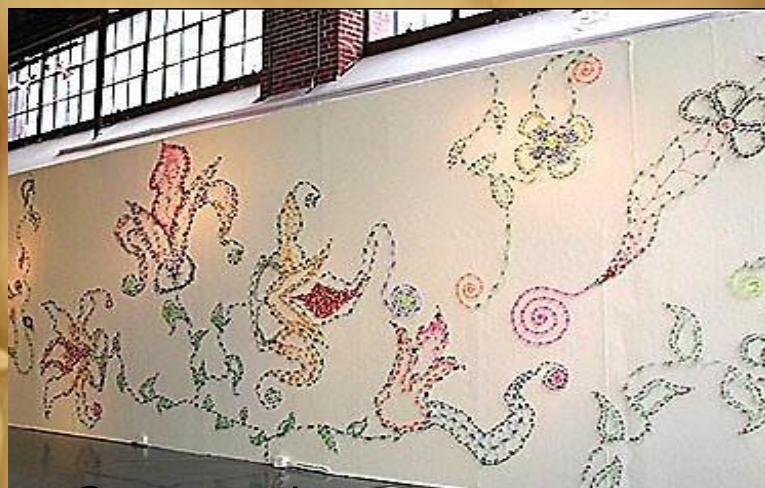
Стена, оформленная в квиллинге /музей в Сан-Франциско/