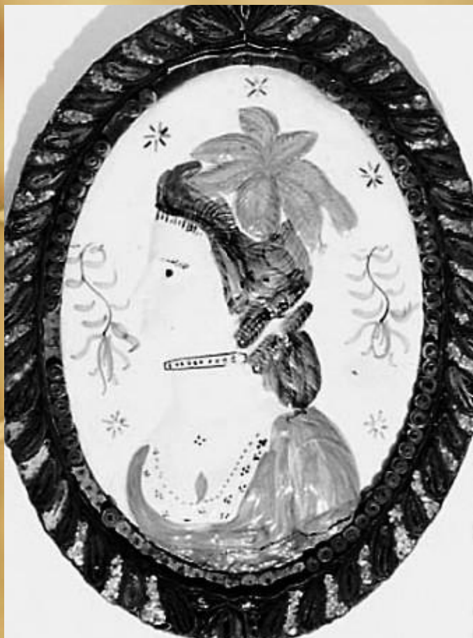
Портрет Маркизы де Сада в рамке из квиллинга