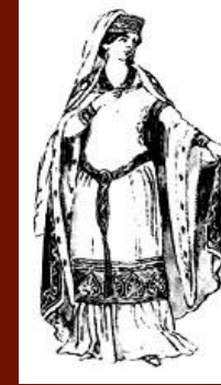
Мода эпохи Крестовых походов