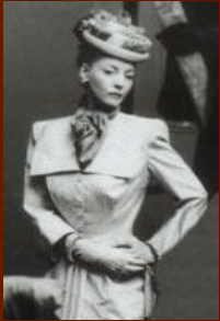
Военная мода 40-х