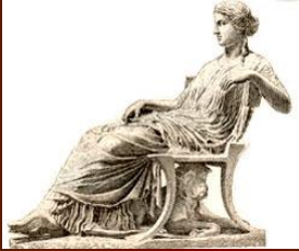
Мода Древней Греции