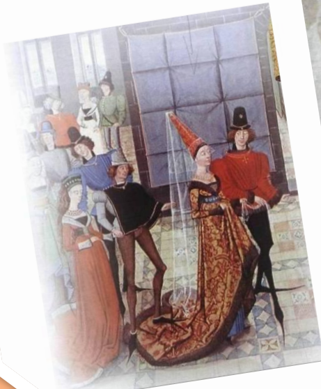
Готический стиль одежды.