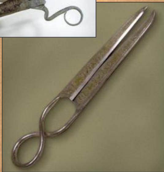
Династия Танг (618 – 907 гг.). 7 – 9 вв.