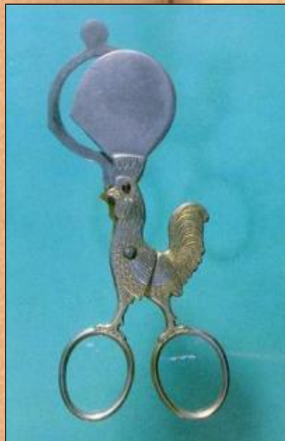
Ножницы для яиц. 1930г.