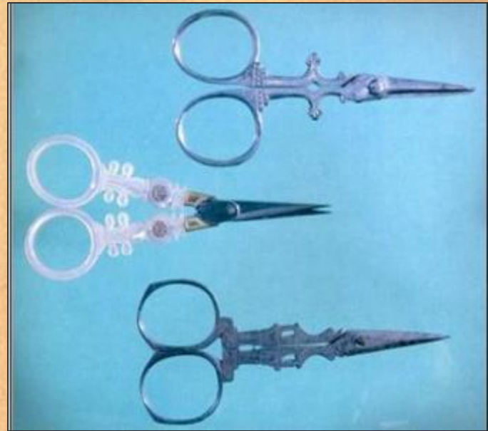
Ножницы для вышивания. Эпоха романтизма. Франция.