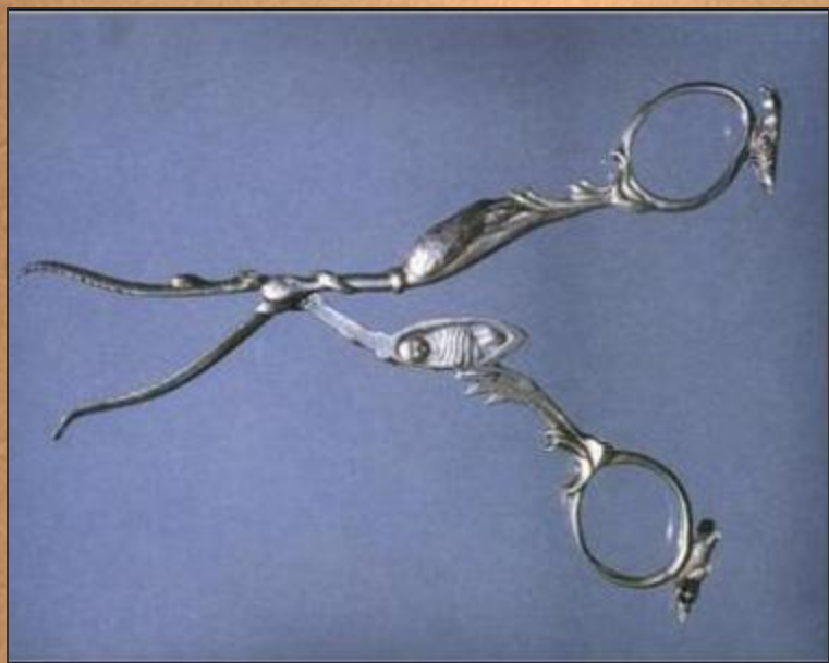
Ножницы в форме аиста, приносящего ребенка. Англия.