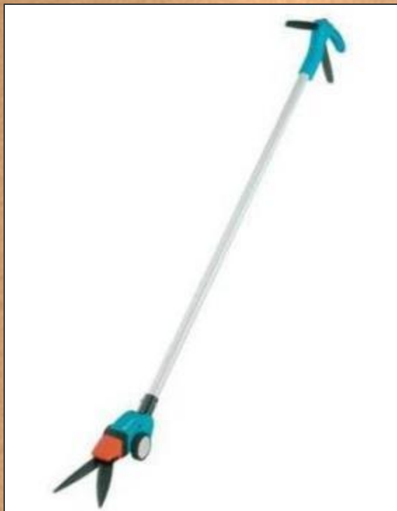
Ножницы для срезки травы