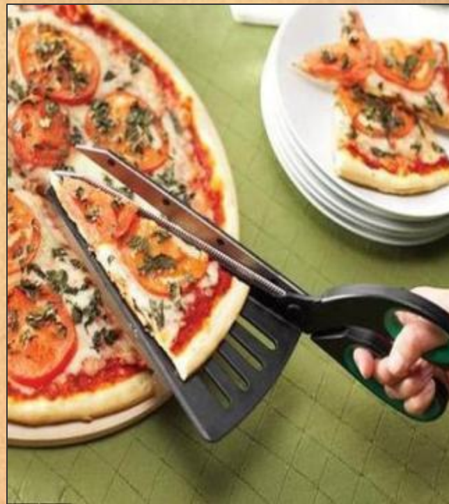
Ножницы для пиццы