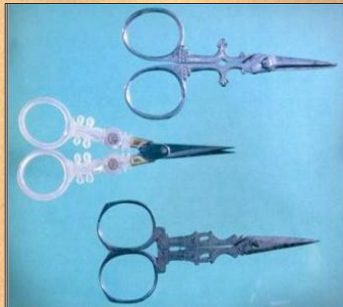
Ножницы для вышивания. Эпоха романтизма. Франция.