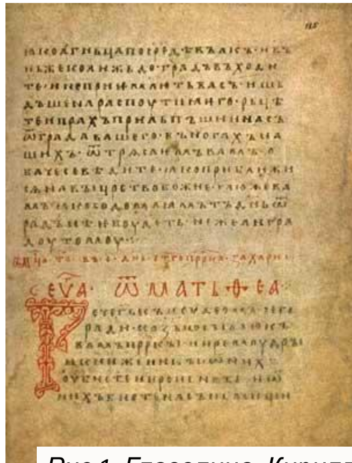
Рис 1. Глаголица. Кириллица