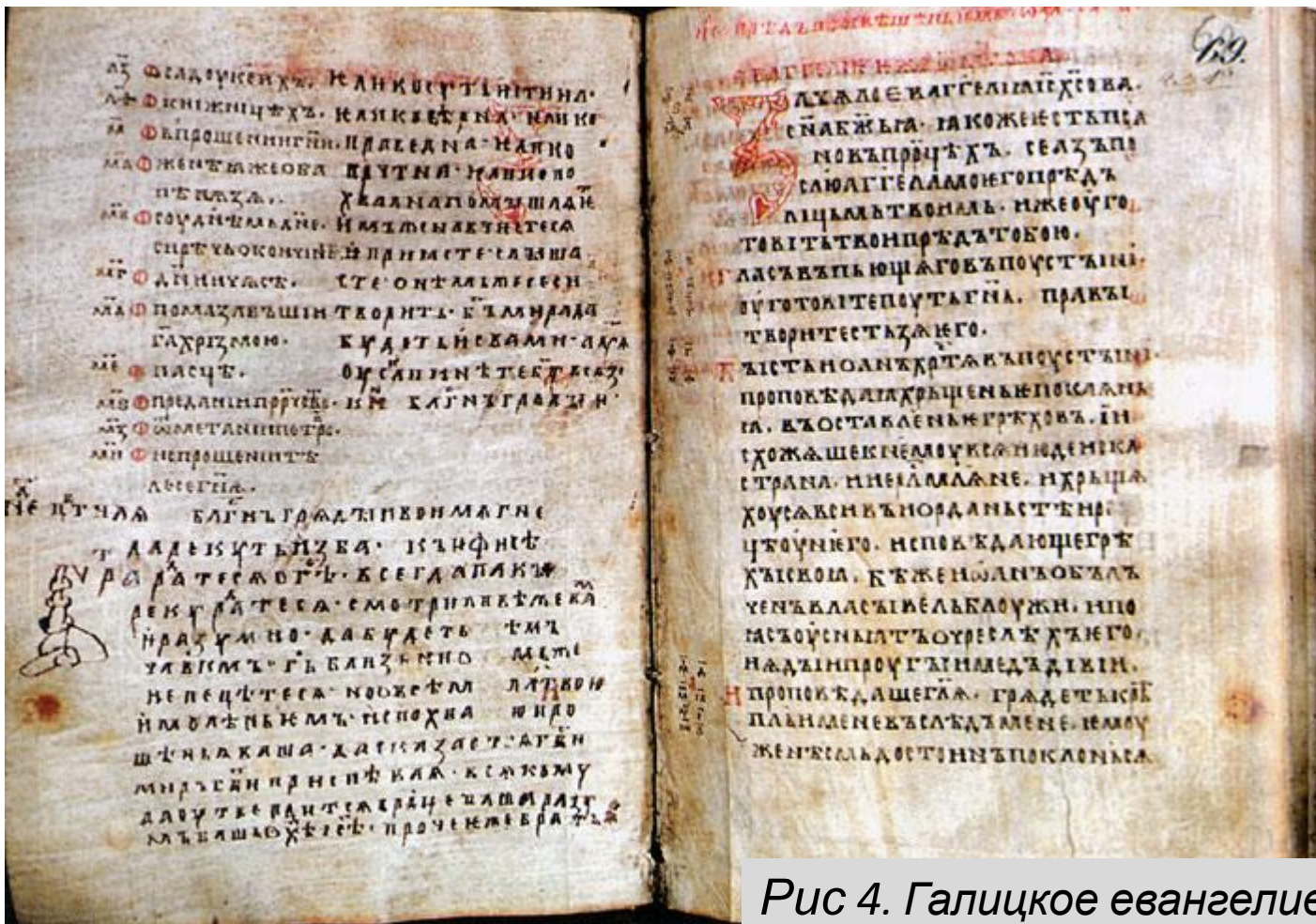
Рис 4. Галицкое евангелие