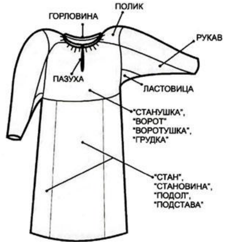
Рис. 5. Конструкция женской рубахи

Само это слово обозначало кусок, обрывок ткани (ср. рубить, рвать). Слово употреблялось так же в значении "бедная, грубая, плохая одежда". Нужно думать, что с того же корня древнейшее русское название нательной мужской и женской одежды "рубаха", бытующее до наших дней.