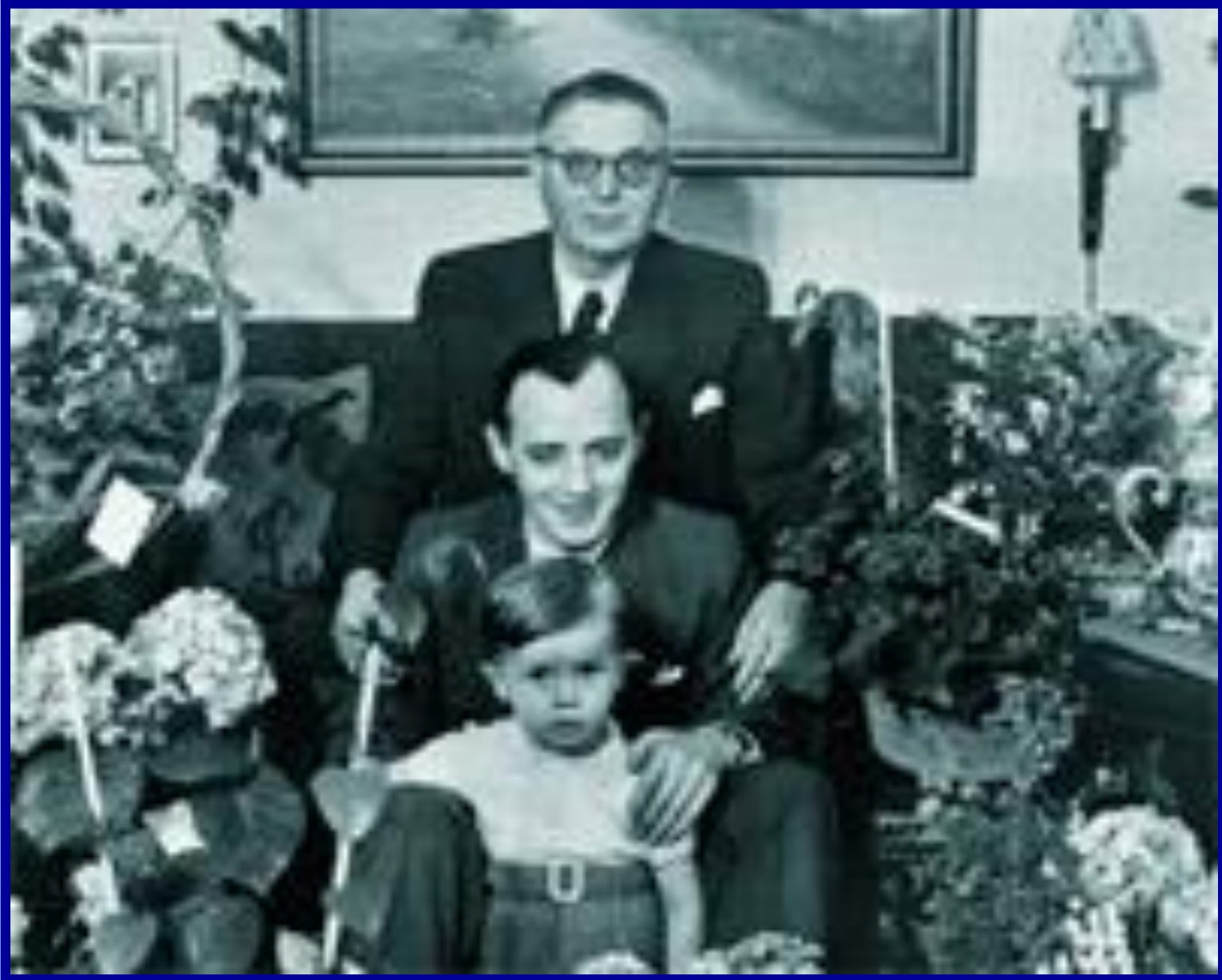
Оле Кирк Христиансен с сыном и внуком