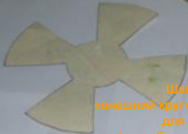
Шаблоны «внешний круг» и «внутренний круг» для цветка ( цвет бумаги по выбору)