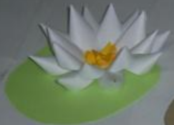
Шаблон «лист» (картон зелёного цвета)