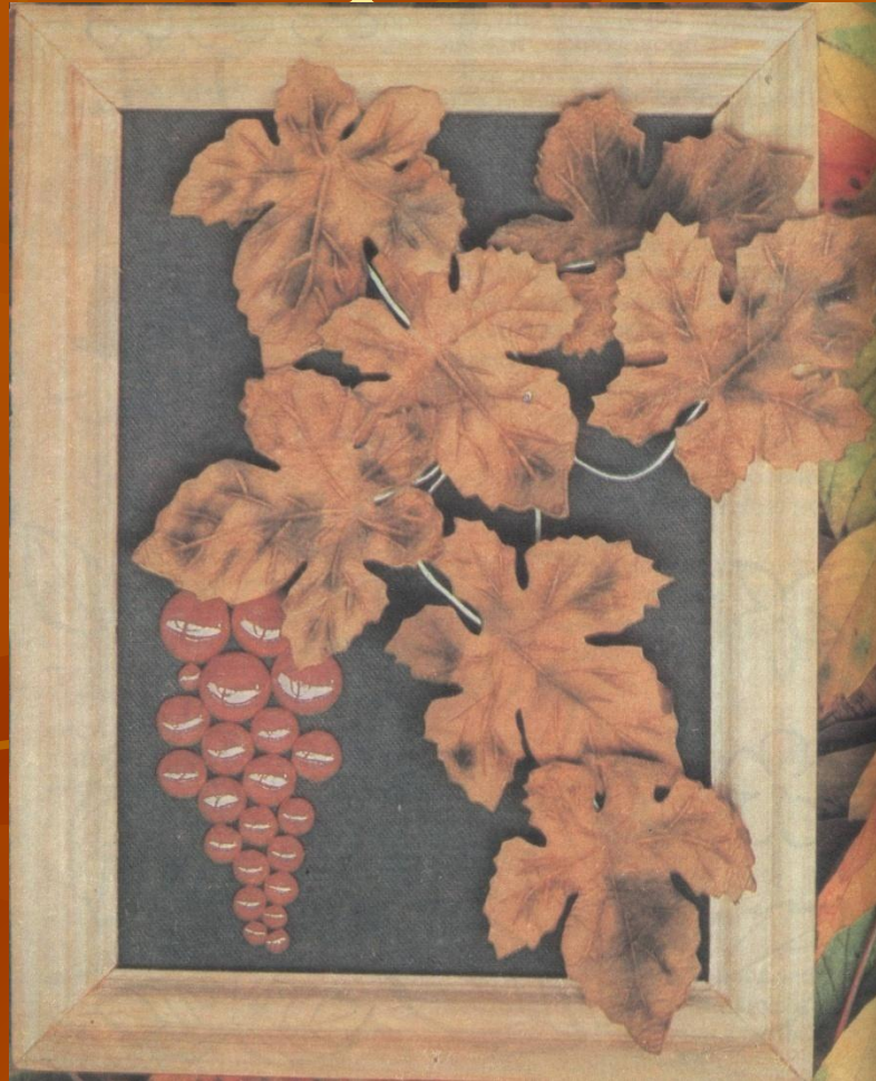
Модель № 2. Панно «Виноград».